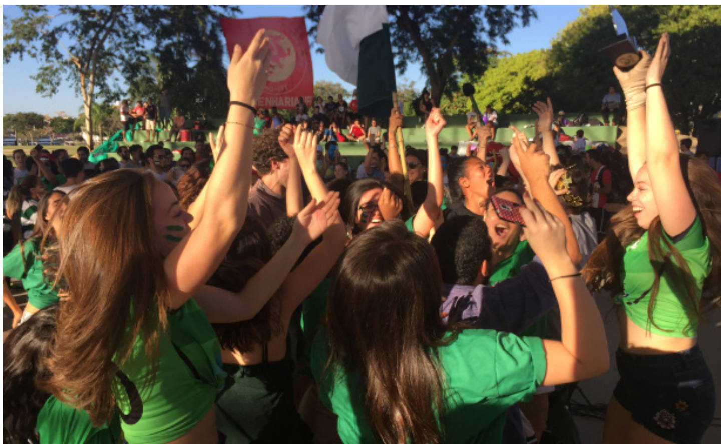
O curso de Enfermagem levou o trofeu de Melhor Torcida.

e Construção do Conhecimento; Cru UFF; Laboratório de Políticas Públicas, Migrações e Refúgio – Escola de Serviço Social – Niterói – Proppi, CNPq; Pastoral Universitária; e Sensibiliza UFF.