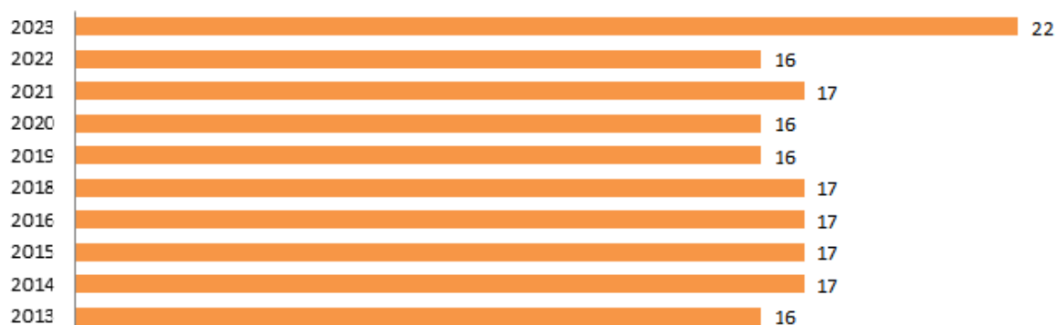
Posição ranking Brasil: UFF