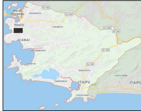
1 LOCALIZAÇÃO NO MUNICÍPIO Sem escala definida