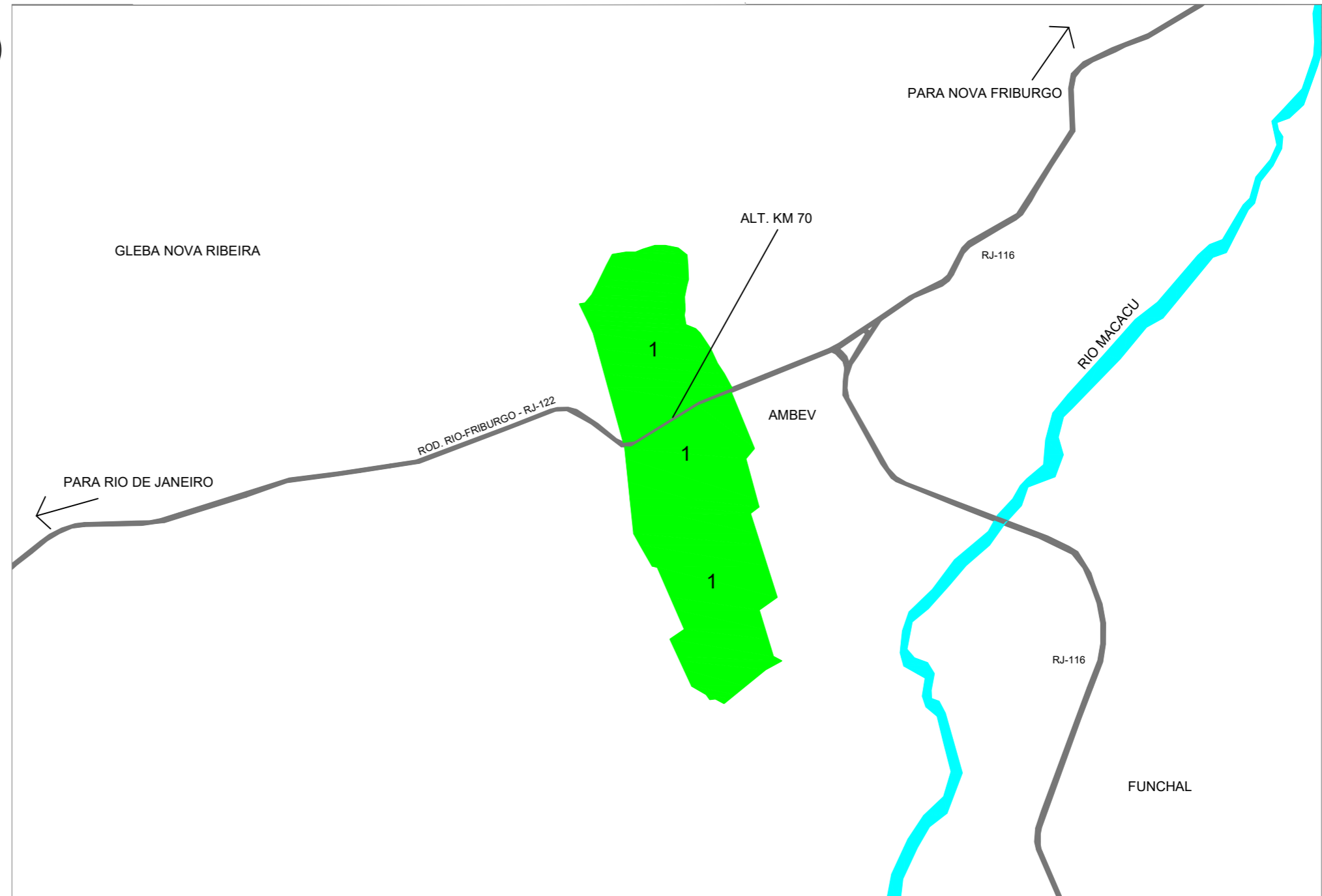
2 LOCALIZAÇÃO DAS PROPRIEDADES Escala: 1/30.000