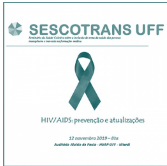
“Seminário da Saúde Coletiva sobre a inclusão com o tema saúde das pessoas transgênero e travestis na formação médica”