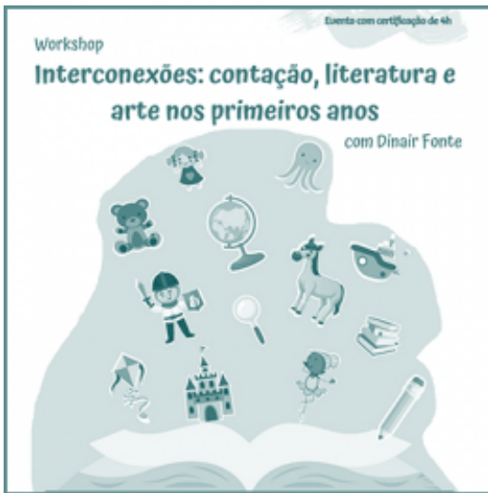
Inscrição no workshop Interconexões: contação, literatura e arte nos primeiros anos