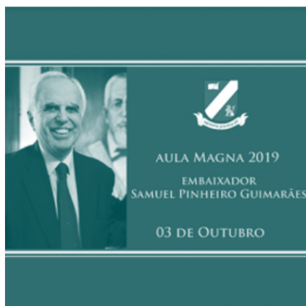
Aula Magna: INEST recebe o embaixador Samuel Pinheiro