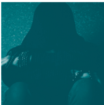
O sofrimento psíquico em estudantes universitários: quem é que nos ouve?