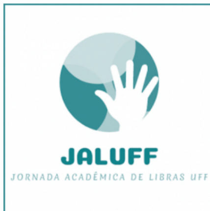
III Jornada Acadêmica de Libras