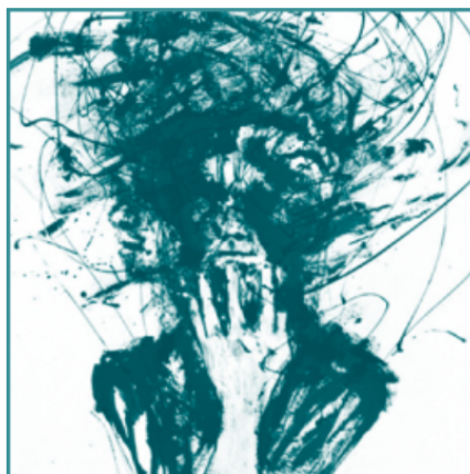
Depressão e ansiedade: entre o normal e o patológico