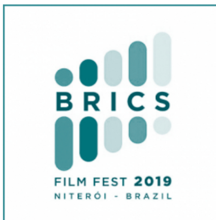
4º Festival de Cinema do BRICS