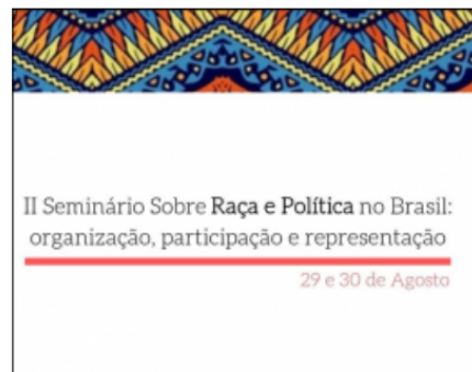
II Seminário sobre raça e política no