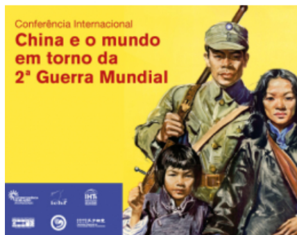
Conferência Internacional "China e o