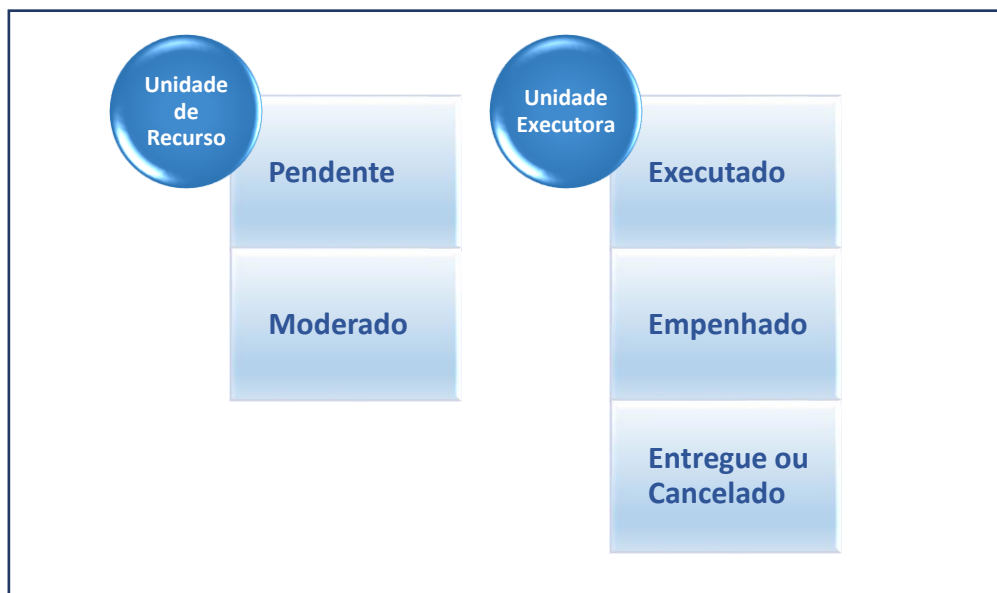
Tipos de Status de Pedidos

Assim como no planejamento, o status de um pedido inteiro se diferencia dos status de cada um de seus itens e o status do pedido só altera quando a ação foi realizada para todos eles.