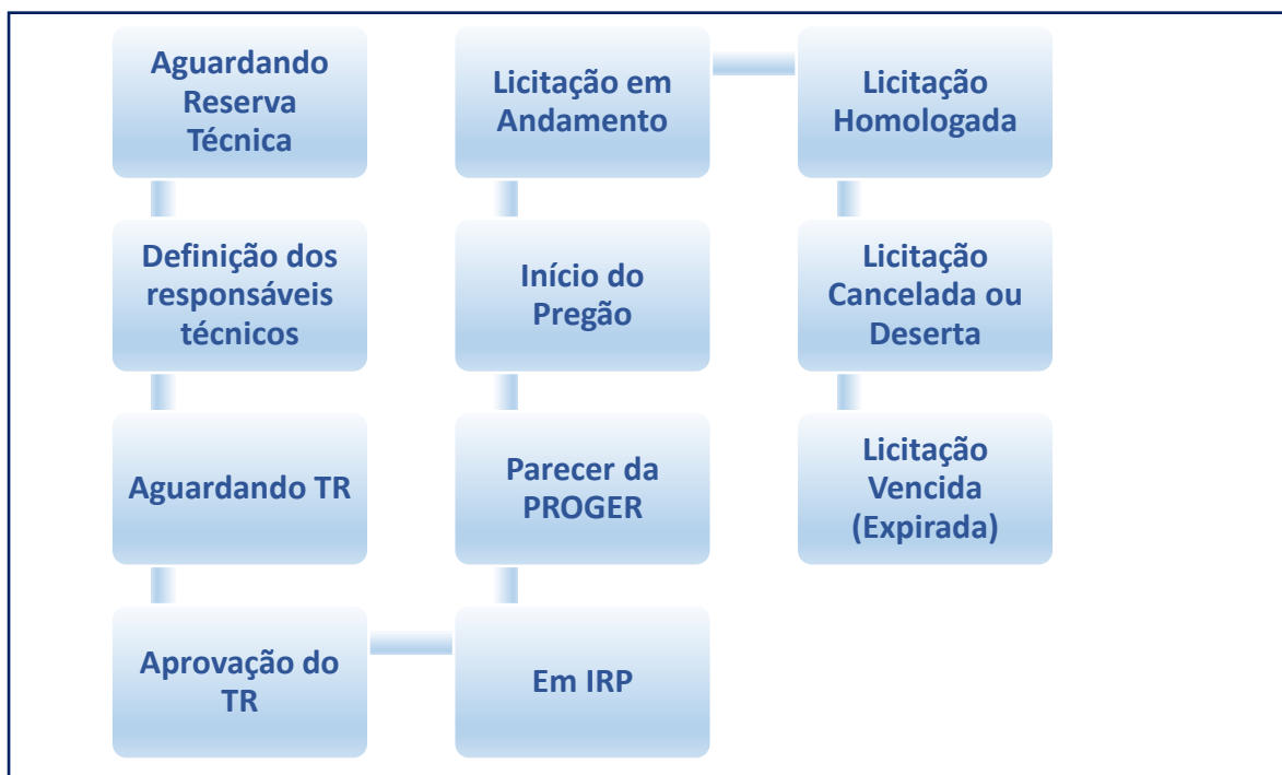
Quadro Status da Licitação