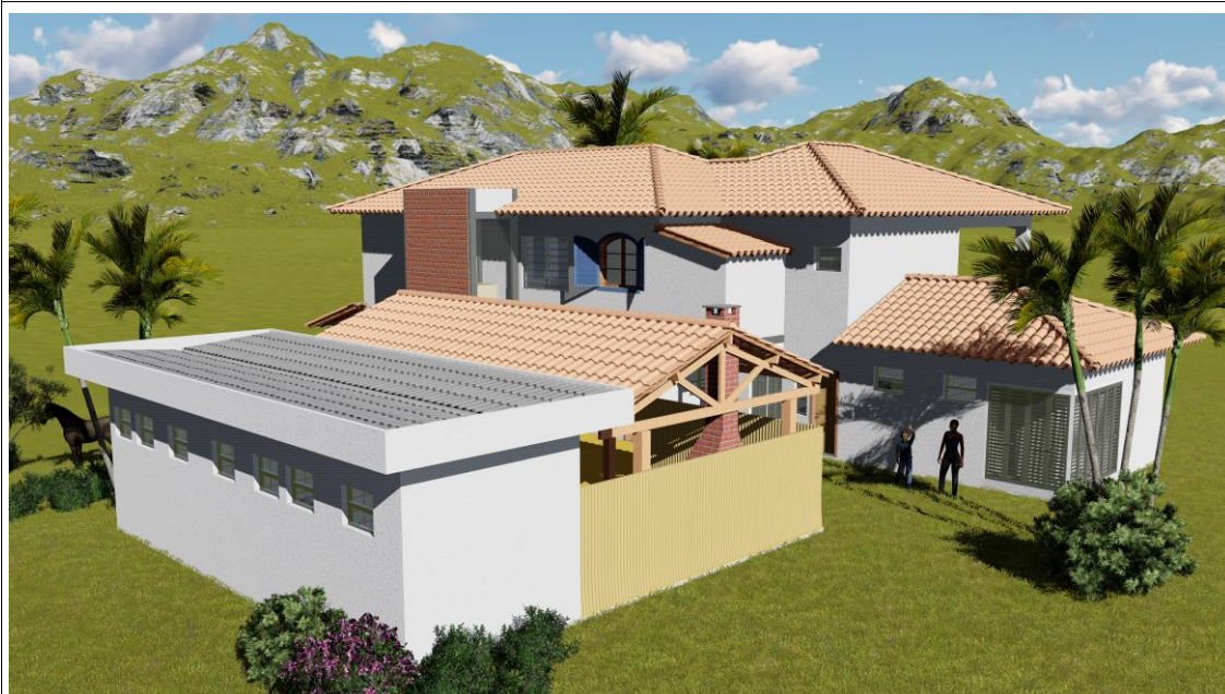
Área dos fundos do anexo do refeitório na sede do Quilombo S. José da Serra