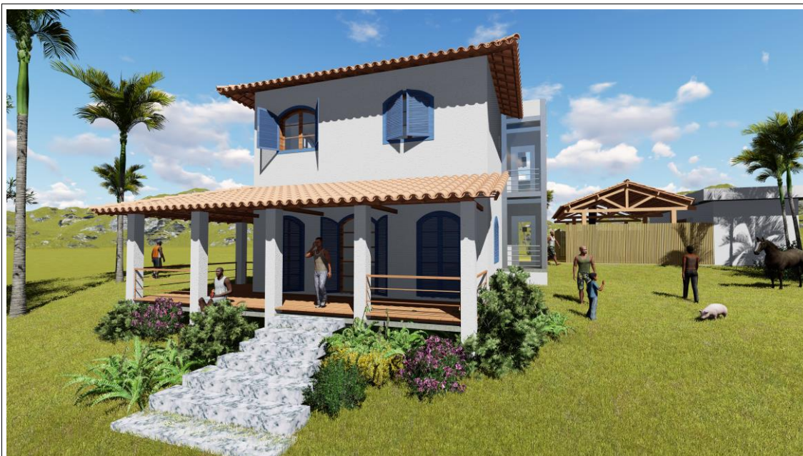
Fachada Principal da sede do Quilombo S. José da Serra