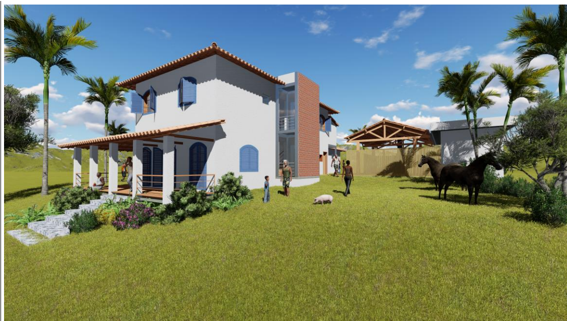
Fachada lateral direita da sede do Quilombo S. José da Serra