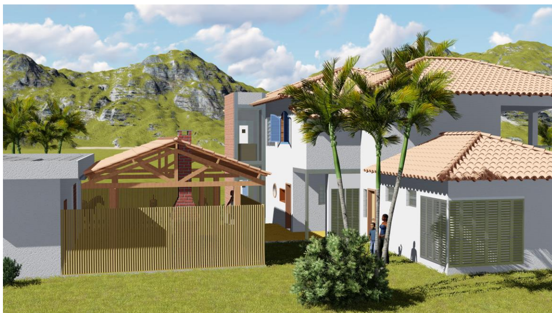
Área dos fundos do anexo do refeitório na sede do Quilombo S. José da Serra