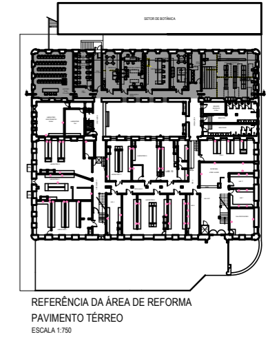
REFERÊNCIA DA ÁREA DE REFORMA PAVIMENTO TÉRREO ESCALA 1:750